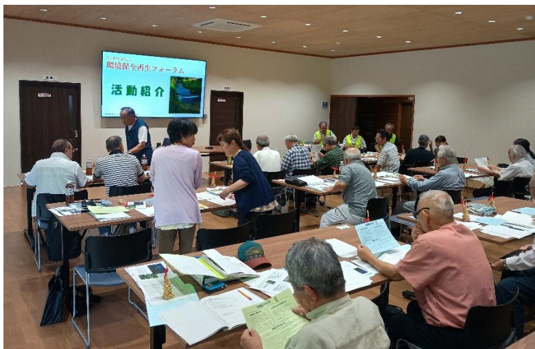
第 3 回ホタルサミット発表会

多くの組織と交流し、源氏ボタルの飼育ばかりでなく、ヒメボタル／平家ボタルなどの県内での発生情報の入手、地域によってはホタルの一般参観のための遮光幕の設置等、参観者配慮への対応、また各組織が抱える問題点の情報交換、飼育水路確保の課題などの多くの情報を得ることができました。